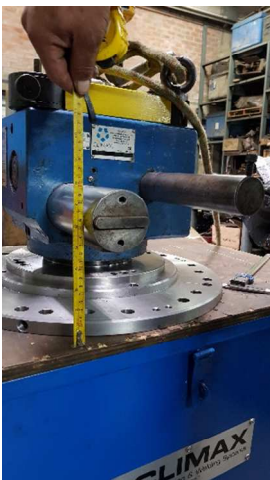
Verificar altura