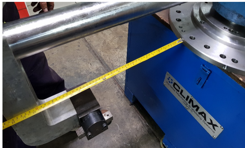
Verificar radio de maquinado