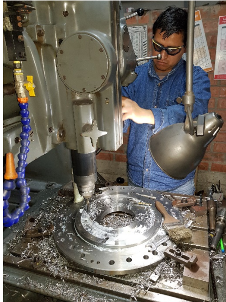
... hay que fabricar un plato ...