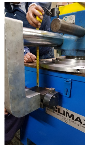
Verificar espesor brida

Si no tiene equipos de maquinado propios, alquile nuestros servicios ... .... y si no tenemos la herramienta requerida, la alquilamos de nuestras representadas !!! Además: hacemos trabajos de ajuste y maquinado en sitio en cualquier parte del Perú.