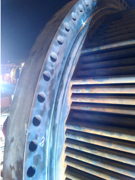
Para maquinar esta superficie ...

Las refrentadoras pueden usarse con placas intermedias para ser usadas en el maquinado de los intercambiadores de calor. Nuestra empresa se ha especializado en la fabricación de estas placas - a la medida requerida y en el menor tiempo posible – en nuestros propios talleres, con máquinas herramientas convencionales y CNC.